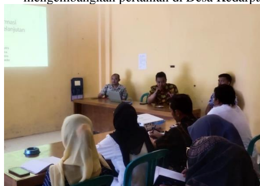
Gambar 3. Sosialisasi Tim Dosen di Desa Kedarpan

Kegiatan akhir adalah dengan mengenalkan laman SICA(Sistem Informasi Cerdan Agribisnis) pada masyarakat desa Kedarpan, yang mana diharapkan setelah warga mengakses laman SICA, warga mendapatkan informasi lebih dalam mengembangkan pertanian di Desa Kedarpan.