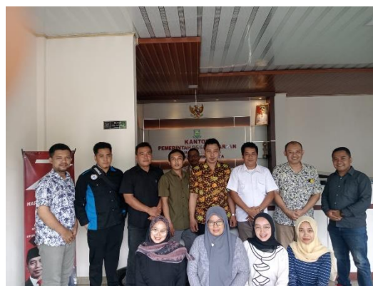
Gambar 4. Foto Bersama Tim Dosen dengan Masyarakat Desa Kedarpan.